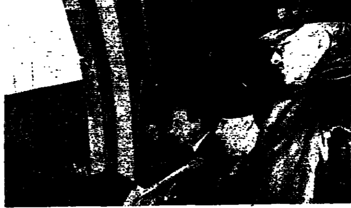
العماد عون يخطب في الجماهير والى جنبه ابي الميمون